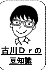
古川 Dr の 豆知識

当院の患者さんでもインフルエンザ感染症が相当増えています。近隣の学級閉鎖、学校閉鎖なども多いですね。同じインフルエンザ A 型でも何種類かあるのですが、東京都の報告を見ると、ワクチンの効果が出やすい種類、出にくい種類の両方とも増えてきているようです。咳エチケットと手洗いで、できる限りの予防をしましょう。