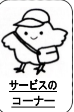
サービスの コーナー